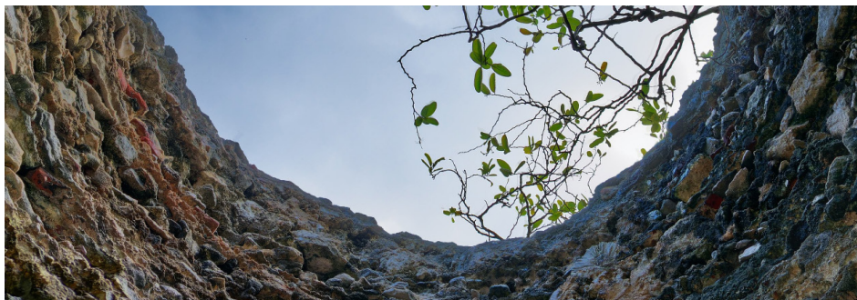
Intérieur du four à chaux, Îlet Fajou

Dans le cadre des Journées européennes de l'archéologie 2026, organisées en partenariat avec le Conseil départemental, l'Institut national de recherches archéologiques préventives (Inrap), la Direction des affaires culturelles (DAC), le Conseil d'architecture, d'urbanisme et de l'environnement (CAUE) de Guadeloupe et la commune de Trois-Rivières, le Parc national de la Guadeloupe participe à la valorisation des patrimoines naturels et culturels de l'archipel. Au travers d'ateliers, de conférences, de randonnées et d'animations, le public pourra découvrir les métiers de l'archéologie, l'histoire de la Guadeloupe, les modes de vie passés et les liens entre les populations et leur environnement. Cette initiative vise à mieux faire connaître ces patrimoines, à encourager leur préservation et à transmettre la mémoire du territoire aux générations futures.