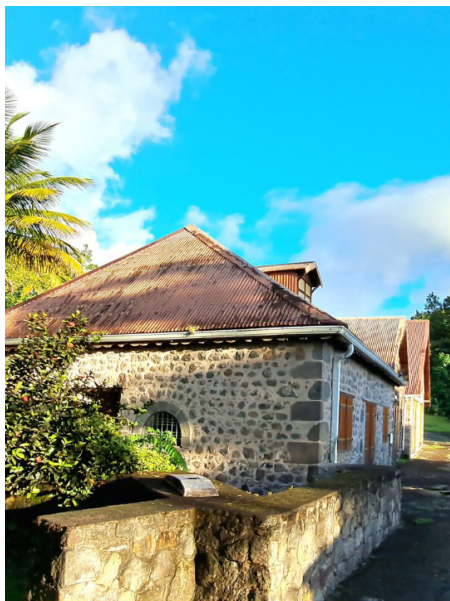
Habitation Beausoleil, Saint-Claude

Présentation des spécialités de l'archéologie, manipulation d'objets et d'outils archéologiques.